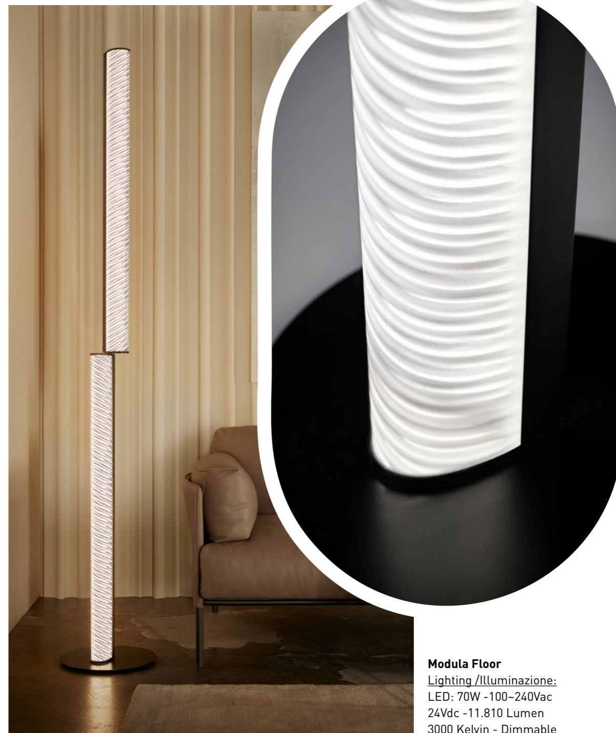
Modula Floor Lighting /Illuminazione: LED: 70W - 100~240Vac 24Vdc - 11.810 Lumen 3000 Kelvin - Dimmable