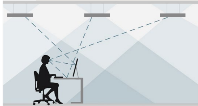
Examples of reflection's glare

Modula is designed to fully comply with the UNI EN 12464-1:2011 standard, which defines the requirements for indoor lighting to ensure visual comfort, safety and efficiency . This standard establishes precise parameters such as illuminance levels, light distribution, glare, colour rendering and colour temperature, ensuring that the lighting is adapted to the specific needs of each space.