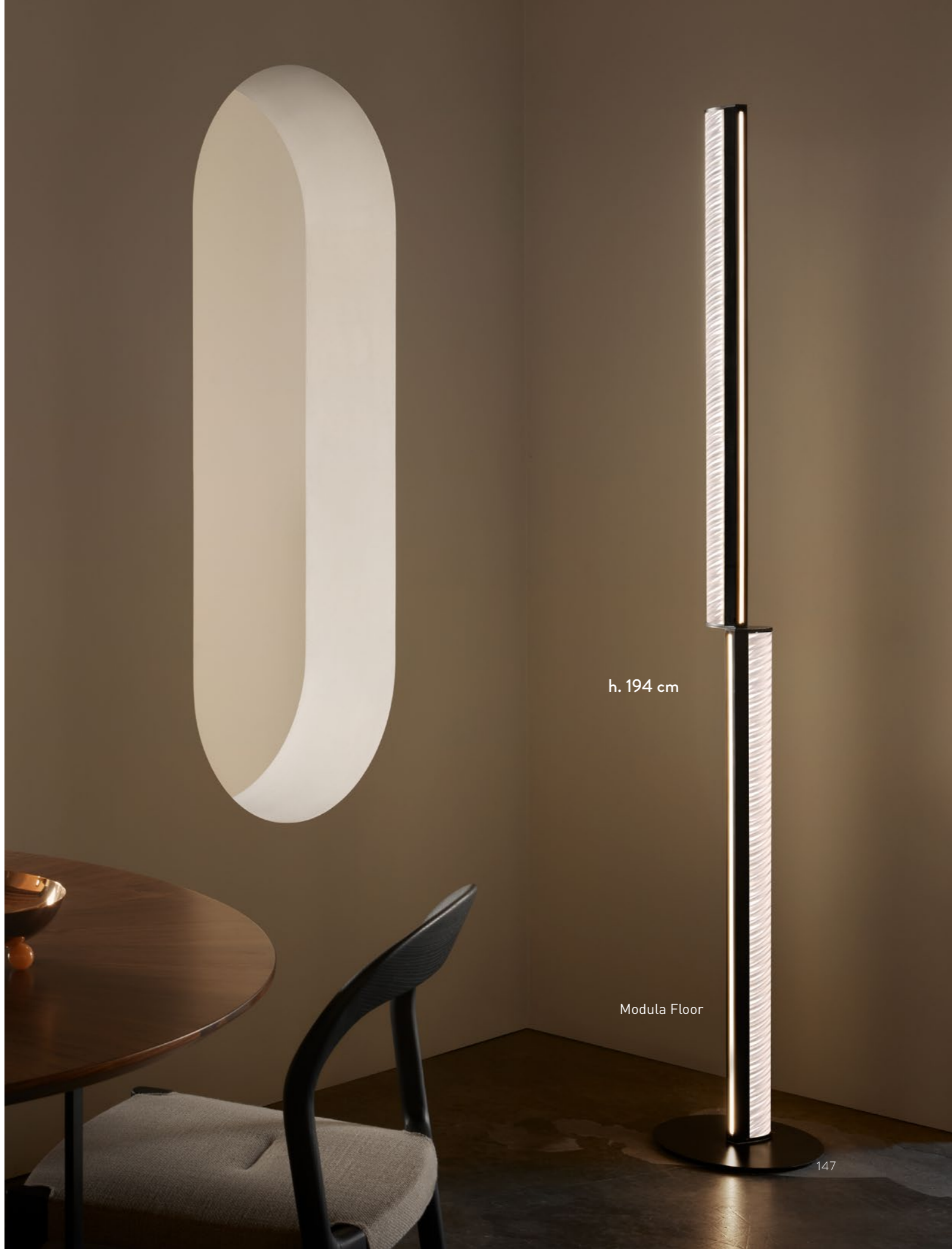
h. 194 cm