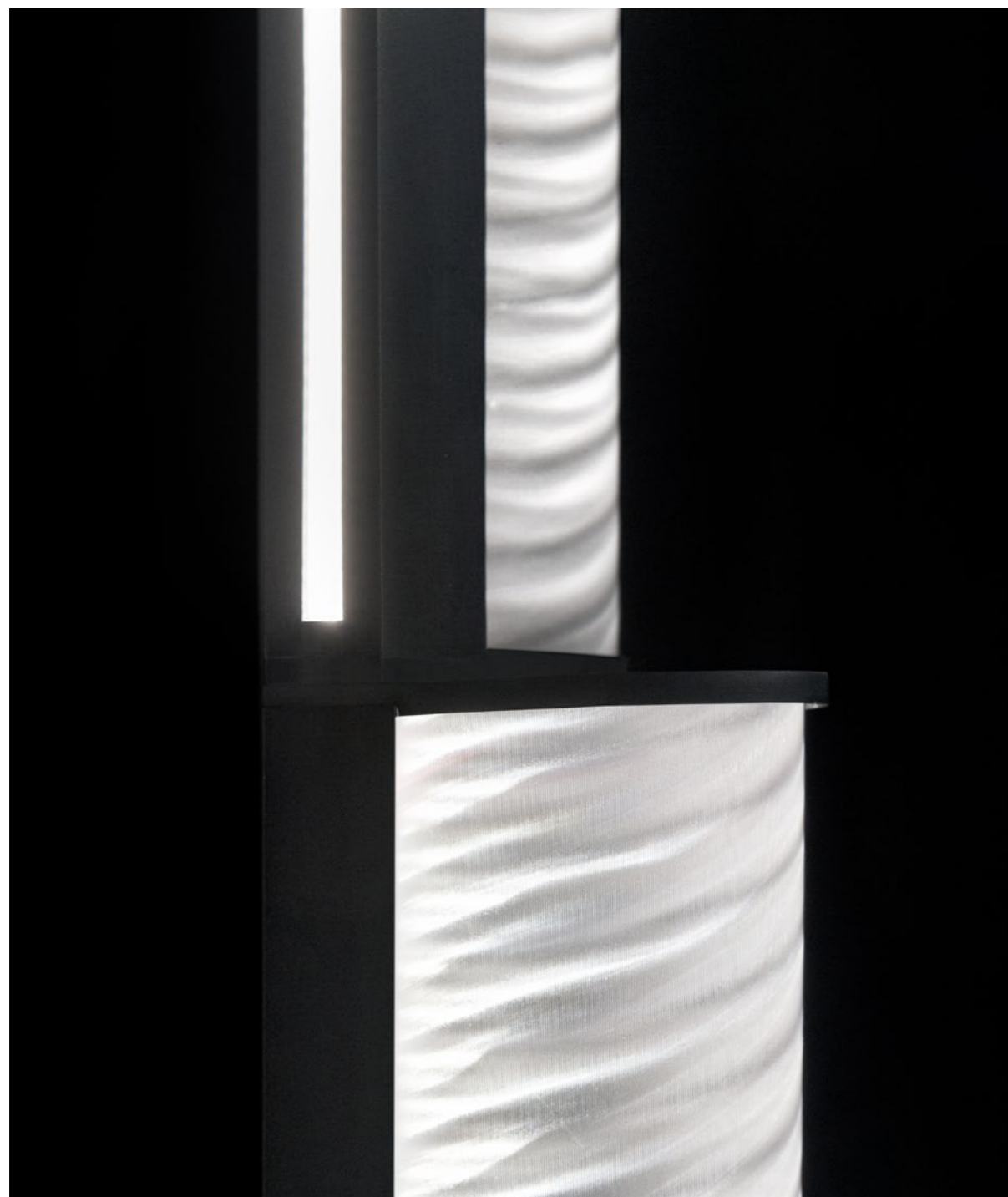
A seamless line of light runs along the spine of the floor lamp, complementing the diffuser's lighting effect. Una linea di luce omogenea corre lungo tutta la dorsale della piantana che si aggiunge all'effetto di luce del diffusore.