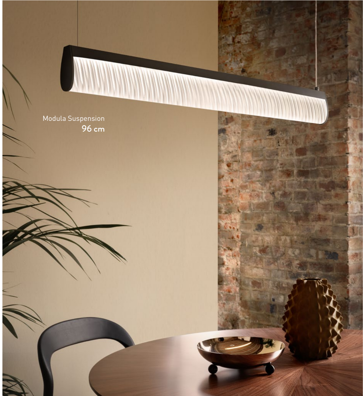
Modula Suspension 96 cm