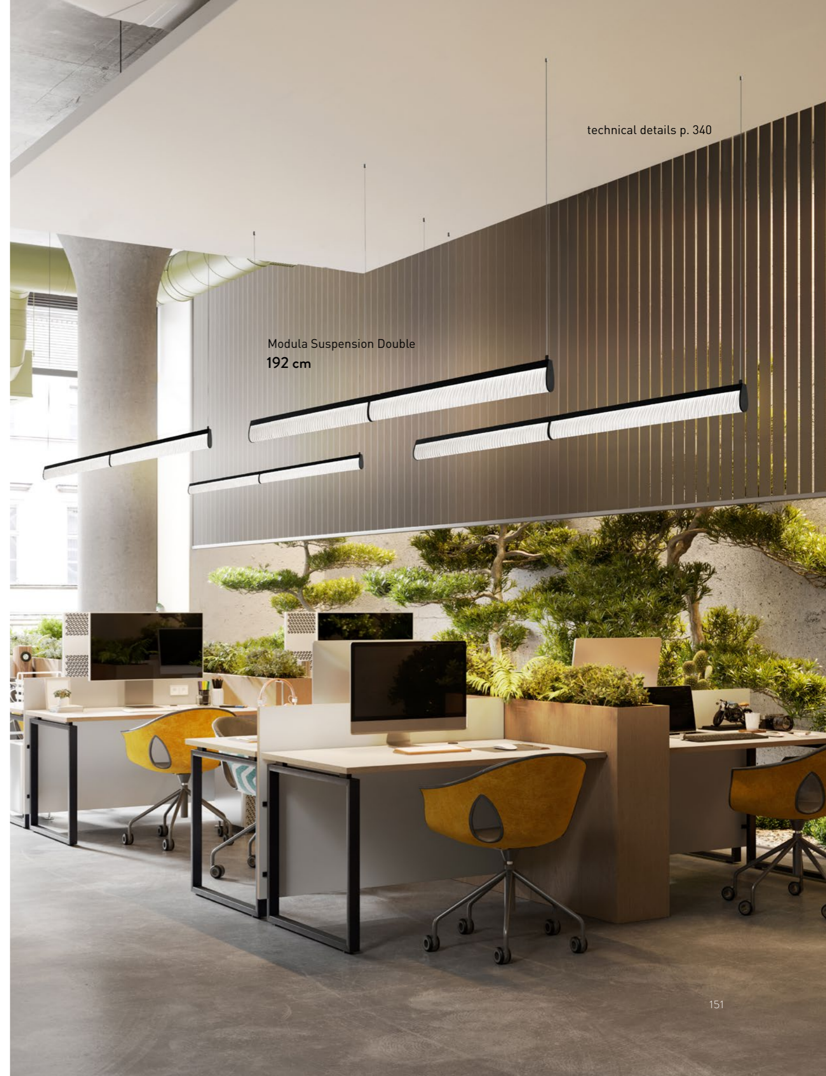
Modula Suspension Double 192 cm