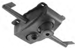
Meccanismo oscillante multiblock 4 posizioni di blocco con tensionatore